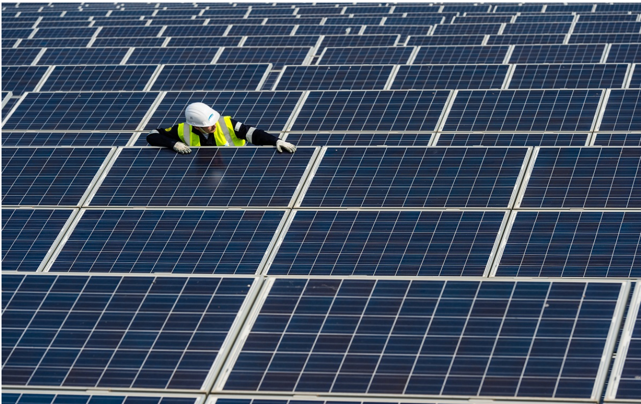
Afbeelding 1